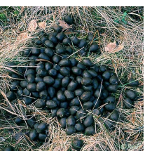
spår av ett djur